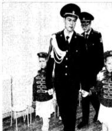
Юные друзья кадетов со старшими товарищами